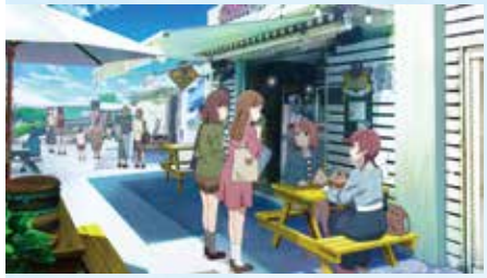
35 瀬長島ウミカジテラス