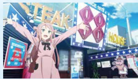
13 ステーキハウス88 恩納店