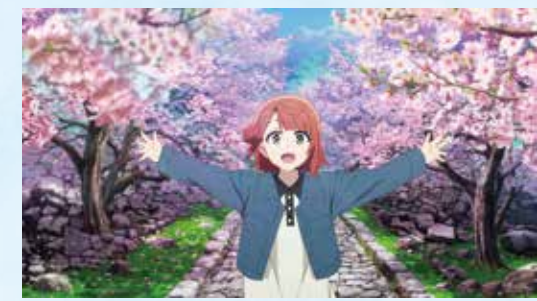
10 世界遺産 今帰仁城跡