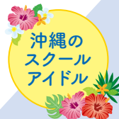
赤嶺 天 AKAMINE TEN CV: 島袋美由利