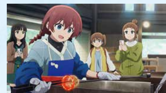
37 おきなわワールド