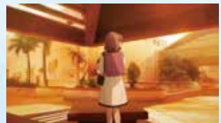
32 パレットくもじ10階/ パレットスカイガーデン